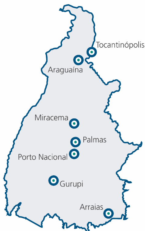
Imagem 1: Mapa do Tocantins com os câmpus da UFT assinalados