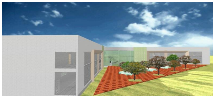
Bloco Administrativo 1, visão lateral