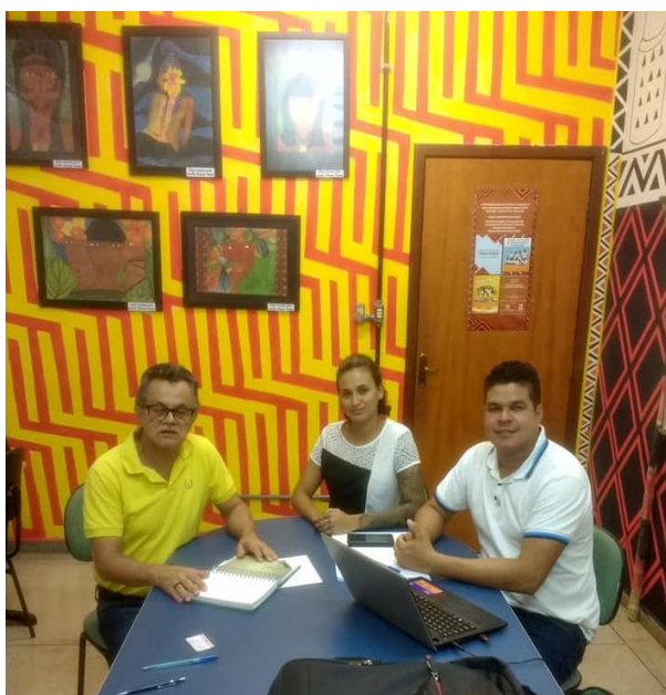
Fig. 2 Instalações do LALI, em momento de orientação de mestrandos (ALBUQUERQUE, 2017)

Frequentam o laboratório professores, alunos e pesquisadores interessados na pesquisa e resgate da cultura e das línguas indígenas do Tocantins e brasileiras. Para fazer parte do Centro de estudos, o pesquisador deverá desenvolver projetos vinculados à temática indígena e cadastrar-se como do referido centro. Destaca-se que um número expressivo de projetos, teses e dissertações resultaram de atividades desenvolvidas junto a esse Núcleo.